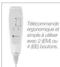
Télécommande ergonomique et simple à utiliser avec 2 (EM) ou 4 (EE) boutons.