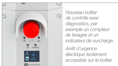
Nouveau boîtier de contrôle avec diagnostics, par exemple un compteur de levages et un indicateur de surcharge. Arrêt d'urgence électrique facilement accessible sur le boîtier.